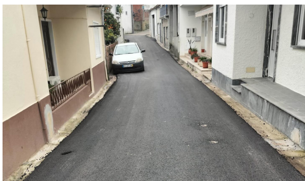
Rua da Restauração