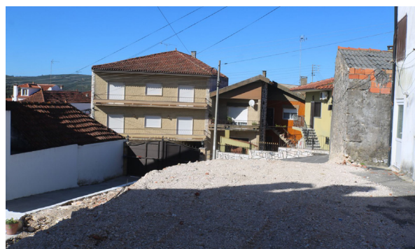
Terreno junto à Rua do Monte