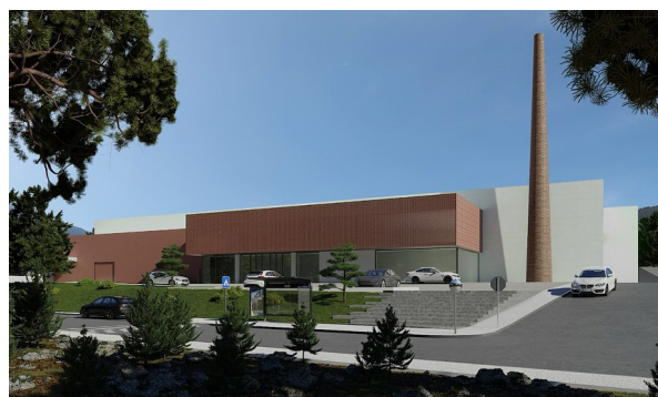
Projeto do futuro Edifício Multiusos

A Junta de Freguesia continuará a acompanhar o desenvolvimento do processo e informará a população sempre que existam progressos relevantes.