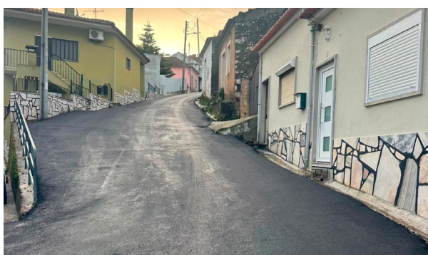
Rua do Monte

No início do ano de 2026 avançou-se com a pavimentação integral de 11 ruas da nossa Vila, fruto de um trabalho conjunto e em parceria entre o Executivo da Junta de Freguesia, a Câmara Municipal de Santarém e a empresa municipal Águas de Santarém, no âmbito da substituição das infraestruturas. As ruas abrangidas foram: a Rua do Monte; Rua de Timor; Rua Francisco Simões Varanda; Rua do Outeirinho; Rua da Restauração; Rua da Esperança; Rua de Baixo; Rua das Escadinhas; Rua da Paz; Rua 9 de Abril; e Rua dos Ferreiros.