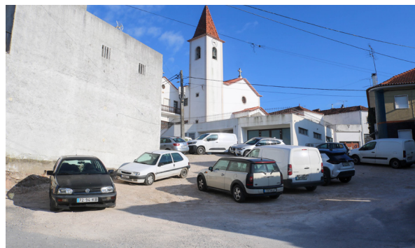
Rua Romeu da Silva Rodrigues junto ao Largo da Casa Mortuária

Mais do que resolver necessidades imediatas, trata-se de construir bases sólidas para o futuro, garantindo que a Vila cresça de forma organizada, com qualidade de vida e capacidade de resposta às necessidades da população. Este é um trabalho que nem sempre é visível a curto prazo, mas que revela a diferença no desenvolvimento sustentado de uma comunidade.