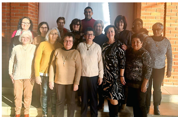
Utentes de Amiais de Baixo do programa da Viver Santarém

A Junta de Freguesia considera que estas parcerias assumem um papel fundamental no desenvolvimento de iniciativas que contribuem para o bem-estar da nossa população. A colaboração entre instituições locais permite otimizar recursos, criar mais oportunidades para os fregueses e reforçar o espírito de entreatajuda que caracteriza a nossa comunidade. A Junta de Freguesia continuará a valorizar e a promover este tipo de cooperação, certos de que, trabalhando em conjunto, será possível responder melhor às necessidades da nossa Freguesia.